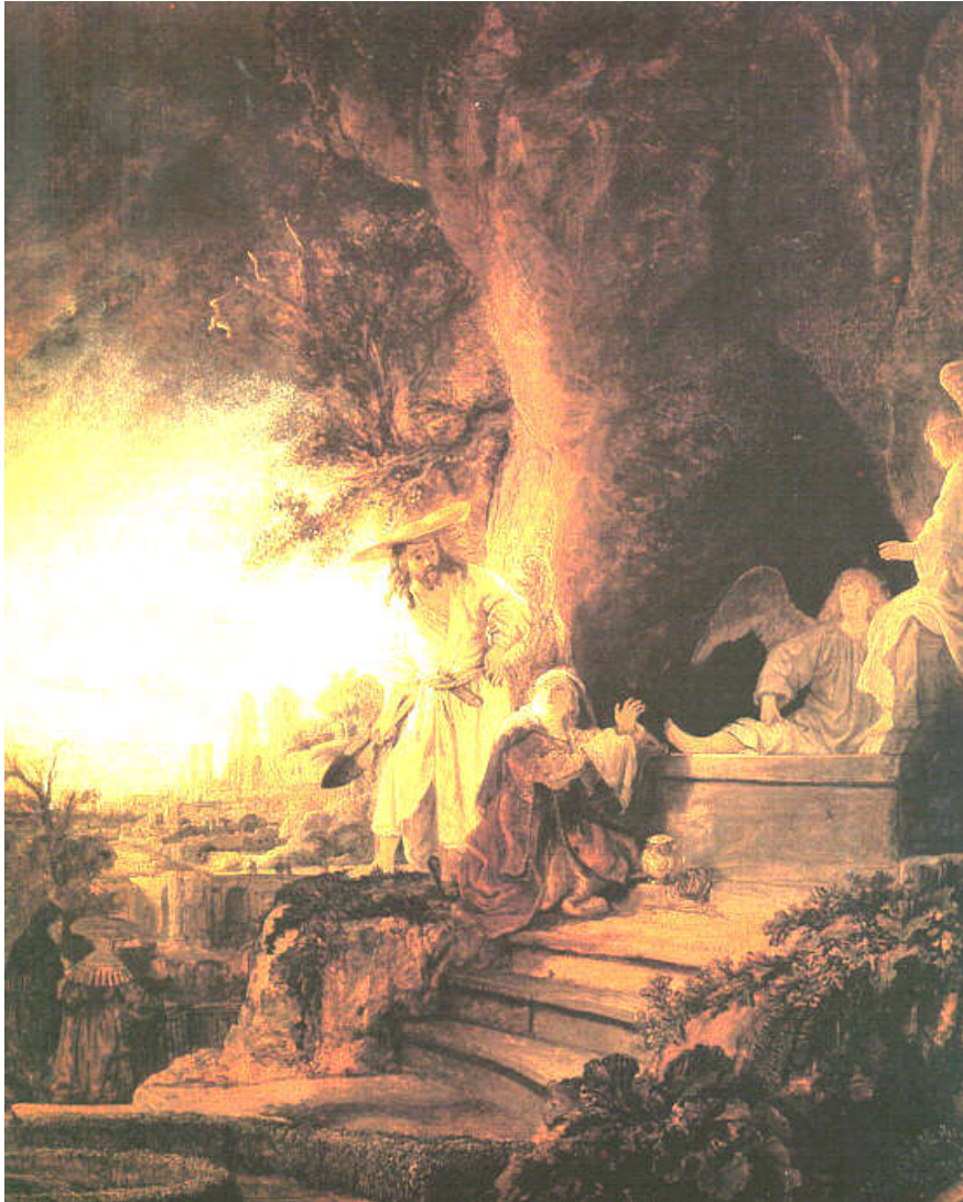
Rembrandt, De Opgestane als hovenier